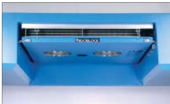
Zweiflutiger Deckenverdampfer, ab 50 mm i.L. erstmals Zwangsluftführung

Während bei den bisher am Markt üblichen Wechselaufbauten der noch hinter der Nische