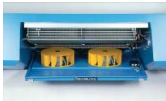
hochfeste GFK-Verkleidung, wärmege- dämmt, extrem leistungsstarke Radial- flachgebläse

FRIGOBLOCK setzt aber auch neue Maßstäbe in bezug auf die Geräusch- und Abgasemissionen